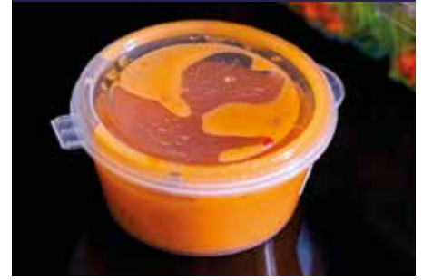
P.42 SALSERAS rPET Y PP P.43 BISAGRA Y PP V