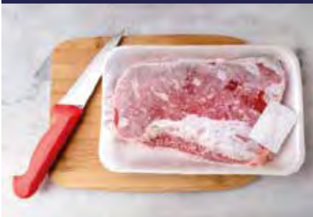
P.57 ENVASE P.58 FILM