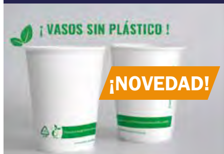
P.15 VASOS KRAFT Y BLANCO P.16 BEBIDA FRÍA Y ONDULADOS