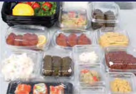
P.43 - 45 BISAGRA Y LONCHEADO P.45 - 46 BISAGRA Y SUSHI P.47 - 49 BANDEJAS Y TARROS