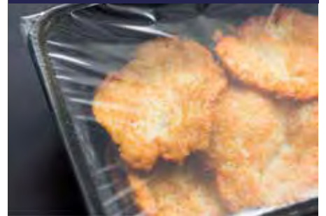
P.52 BANDEJA P.52 FILM P.52 MÁQUINA