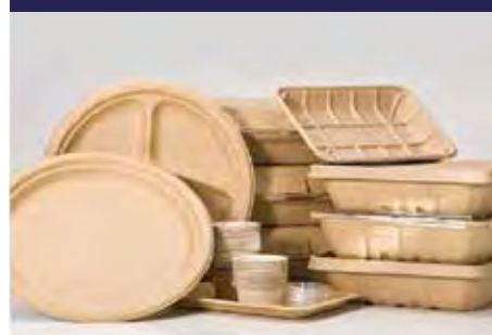
P.22 BANDEJAS Y SALSERAS P.23 BOLS Y ENVASES