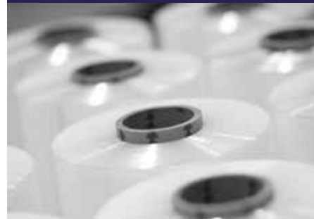
P.69 FILM AUTOMÁTICO