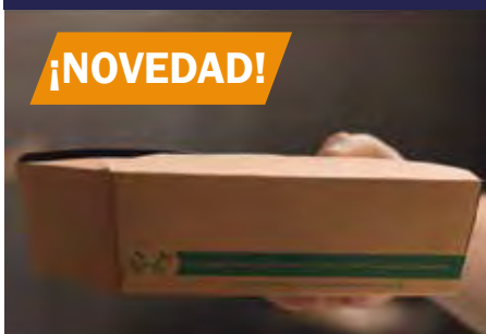
P.6 ENVASES Y BARQUETAS P.7 ENVASE HAMBURGUESA