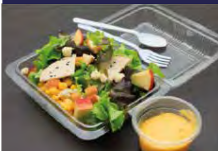
P.10 ENVASE BISAGRA PLA