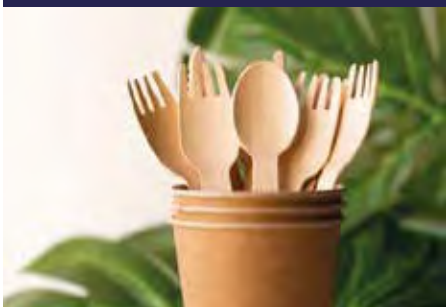
P.13 CUBIERTOS CPLA P.14 BIODEGRADABLE Y MADERA