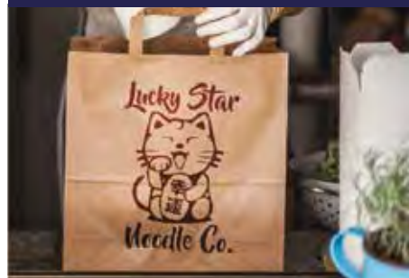
P.11 ASA PLANA Y ASA RIZADA P.12 SOS, CON ZIP Y PARA PAN