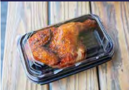
P.50 ENVASE BISAGRA P.51 ENVASES CON TAPA P.51 ENVASE POLLO