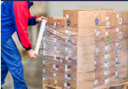
P.65 FILM EXTENSIBLE MANUAL