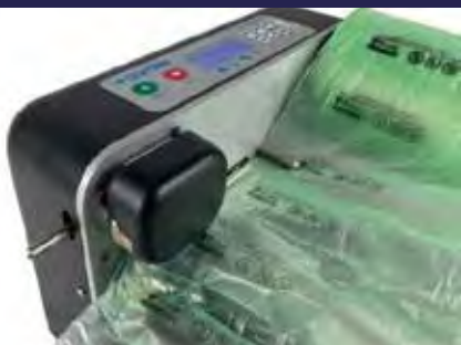
P.70 AIR CUSHION FILM