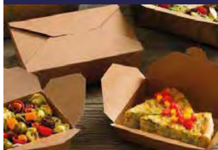
P.7 CAJA CON BISAGRA