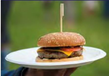
P.40 PLATOS PS