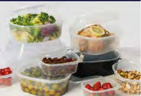
P.53 BISAGRA P.54 TARRINA Y SALSERA P.55 BANDEJAS