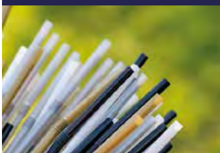
P.21 CAÑITA PAPEL y CAÑITA PLA