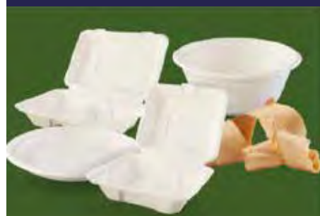
P.8 BOLS, PLATOS y ENVASES