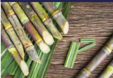
P.9 ENVASES y PLATOS P.10 BANDEJA Y SALSERA