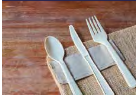
P.41 CUBIERTOS PS P.42 PINCHOS, MESITA PIZZA Y PALETINA