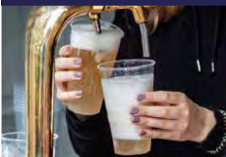
P.19 VASOS Y TAPAS PLA P.20 VASOS Y TAPAS MÍNINA